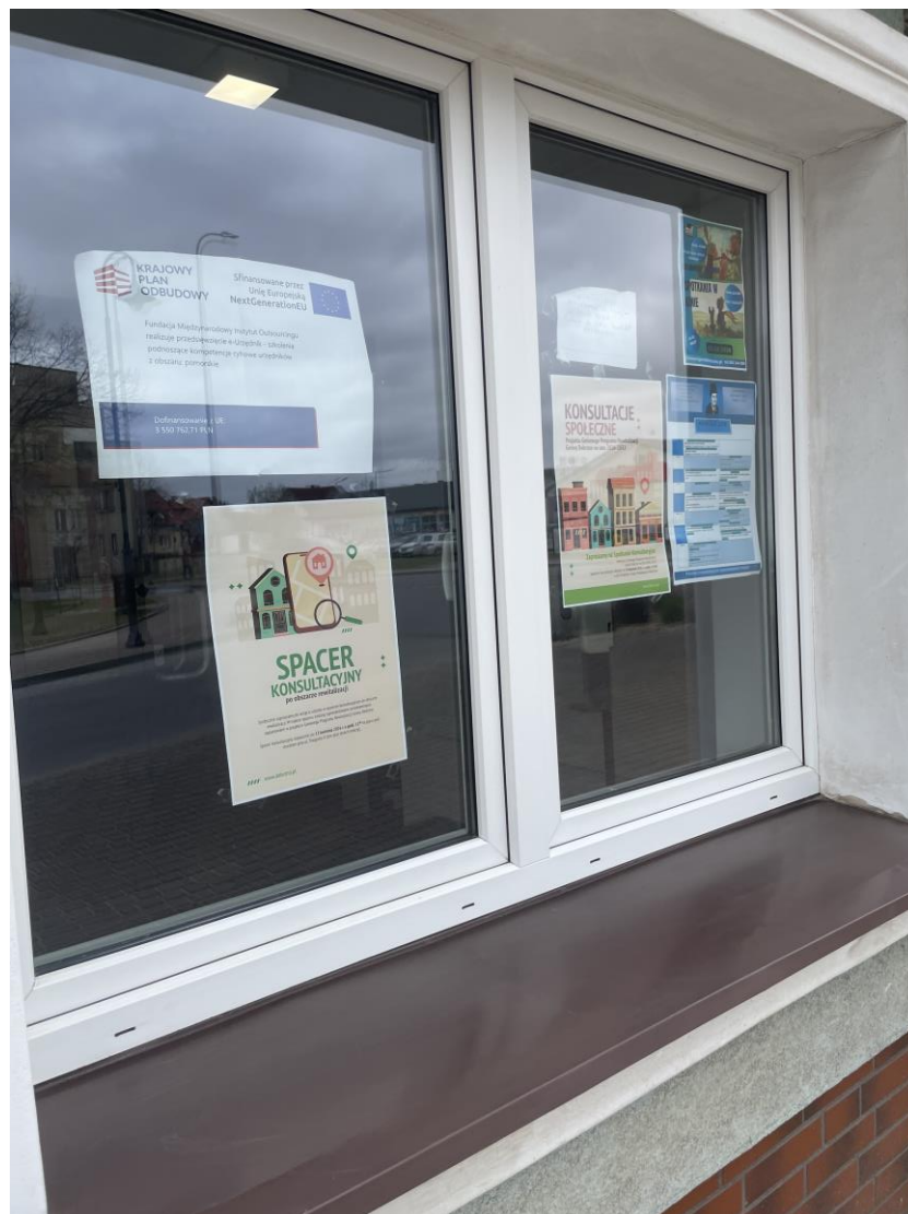
Zdjęcie 1. Ogłoszenia dotyczące różnych form konsultacji w przestrzeni miejskiej obszaru rewitalizacji