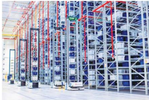
W centrach magazynowych LPP pracuje już flota 3500 robotów

W magazynach LPP Logistics pracują roboty odpowiadające za transport, pobieranie i odkładanie ustandaryzowa-