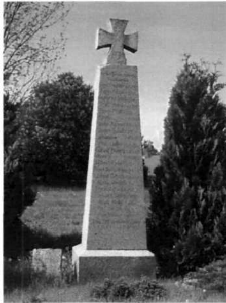
Zdjęcie 1 Pomnik poświęcony poległym w I wojnie światowej mieszkańcom Słupia

W Słupii znajduje się także pomnik wzniesiony w 1925 r., poświęcony mieszkańcom poległym w I wojnie światowej. Podczas II wojny światowej Niemcy wycofując się ze Słupii w obawie przed bolszewikami zakopali go obok istniejącego obecnie przystanku autobusowego. O jego istnieniu mieszkańcy Słupii dowiedzieli się od dawnych mieszkańców i ich potomków, którzy w latach 90' przyjechali z Niemiec. W 1997 r. pomnik został wykopany i przeniesiony na teren cmentarza ewangelickiego. W 2000 r. został on odnowiony. Pomnik jest unikatowym obiektem w Mieście i Gminie Debrzno.