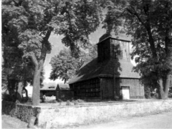
Zdjęcie 2 Kościół p.w. Św. Michała Archanioła