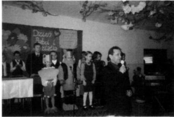
Zdjęcie 5 Dzień Seniora

Dożynki Wiejskie, Festyn Integracyjny, Dzień Strażaka, Dzień Seniora, Dzień Dziecka, Choinka dla Dzieci.