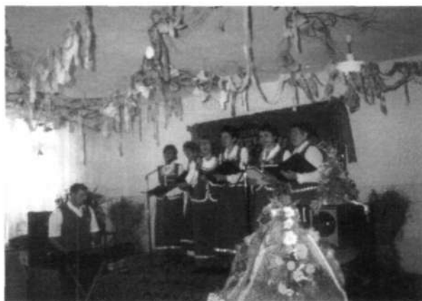
Zdjęcie 4 Występ zespołu "Słupianki" podczas Dożynek Wiejskich