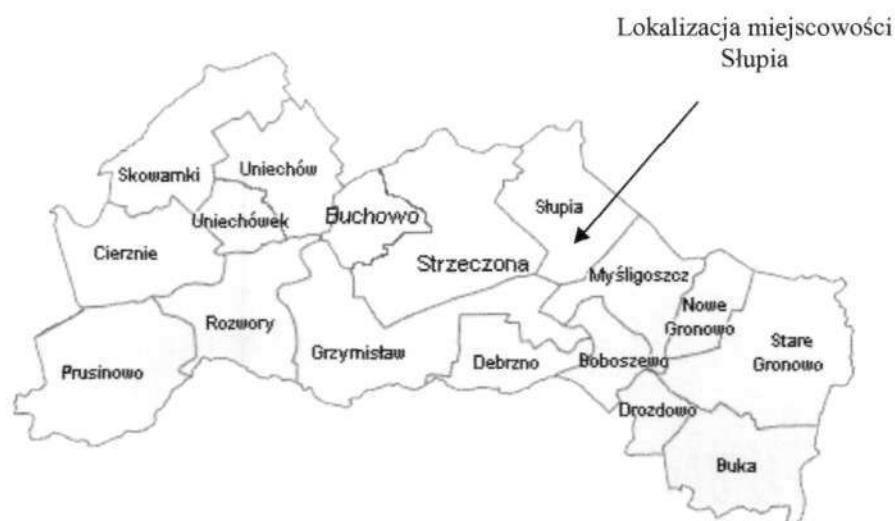
Rysunek 1 Lokalizacja miejscowości na tle innych sołectw

Stanowi jedno z szesnastu sołectw, wchodzących w skład Gminy Debrzno. Od zachodu sąsiaduje z sołectwem Strieczona i Grzymistaw, od północy z Mosinami, od wschodu z sołectwem Myśligoszcz. Wieś oddalona jest o 6 km od miasta Debrzno.