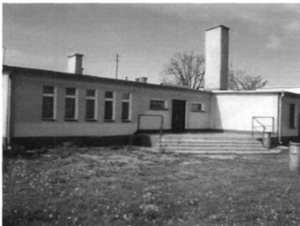
Zdjęcie 3 Świetlica wiejska - widok od strony placu zabaw

Znajdująca się w Słupii świetlica wiejska powstała w zmodernizowanym budynku starej szkoły z 1972 r. Pomieszczenia wymagają remontu, a zaplecze kuchenne doposażenia. Wymiany wymagają także okna.