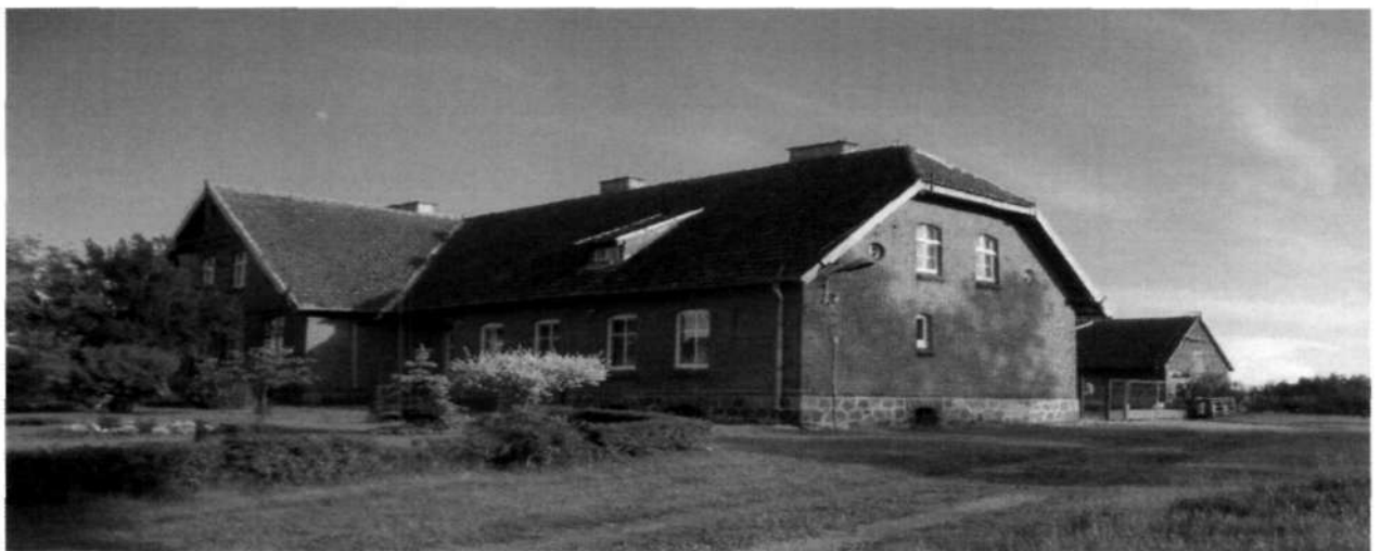
Budynek szkoły, podlegający ochronie.