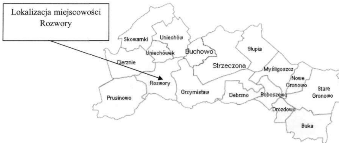
Mapa: Lokalizacja miejscowości na tle innych sołectw Gminy Debrzno