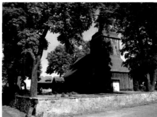
Zdjęcie 2 Kościół p.w. Św. Michała Archanioła