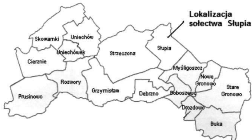
Rysunek 1 Lokalizacja miejscowości na tle innych sołectw

Stanowi jedno z piętnastu sołectw, wchodzących w skład Gminy Debrzno. Od zachodu sąsiaduje z sołectwem Strzeżona i Grzymistaw, od północy z Mosinami, od wschodu z sołectwem Myśligoszcz. Wieś oddalona jest o 6 km od miasta Debrzno.