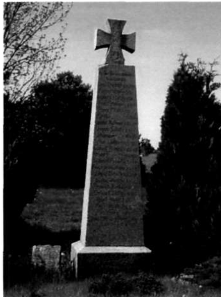
Zdjęcie 1 Pomnik poświęcony poległym w I wojnie światowej mieszkańcom Słupia

W Słupiu znajduje się także pomnik wzniesiony w 1925 r., poświęcony mieszkańcom poległym w I wojnie światowej. Podczas II wojny światowej Niemcy wycofując się ze Słupia w obawie przed bolszewikami zakopali go obok istniejącego obecnie przystanku autobusowego. O jego istnieniu mieszkańcy Słupia dowiedzieli się od dawnych mieszkańców i ich potomków, którzy w latach 90' przyjechali z Niemiec. W 1997 r. pomnik został wykopany i przeniesiony na teren cmentarza ewangelickiego. W 2000 r. został on odnowiony. Pomnik jest unikatowym obiektem w Mieście i Gminie Debrzno.