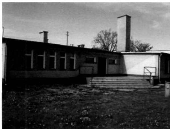
Zdjęcie 3 Świetlica wiejska - widok od strony placu zabaw

Znajdująca się w Słupi świetlica wiejska powstała w zmodernizowanym budynku starej szkoły z 1972 r. Pomieszczenia wymagają remontu, a zaplecze kuchenne doposażenia. Wymiany wymagają także okna.