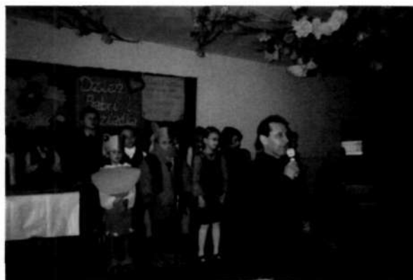
Zdjęcie 5 Dzień Seniora