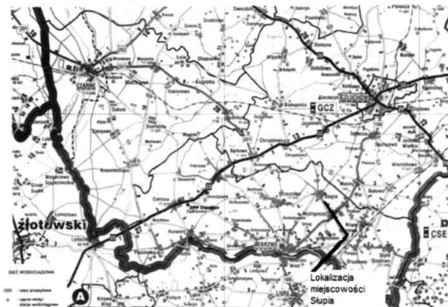
Rysunek 3 Mapa z ukazaną siecią dróg w gminie Debrzno

Ok. 30 % gospodarstw posiada Internet. We wsi przeważa Internet radiowy ze względu na cenę, niższą niż oferowana przez TP S.A. Tego typu łącze bardzo dobrze sprawdza się na płaskim, niezadrzewionym terenie, na którym położona jest wieś.