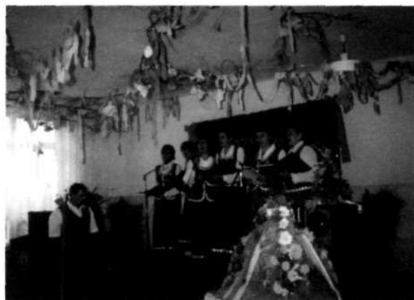
Zdjęcie 4 Występ zespołu "Słupianki" podczas Dożynek Wiejskich

Społeczność lokalna zamieszkująca Słupię jest bardzo aktywna. Przewodniczy jej sołtys wsi Zbigniew Żugaj i Rada Sołecka. W sołectwie działają, obok Rady Sołeckiej, następujące organizacje: Ochotnicza Straż Pożarna (18 członków), Goło Gospodyń Wiejskich, Zespół Folklorystyczny „Słupianki” (8 członkiń), Rada Parafialna.