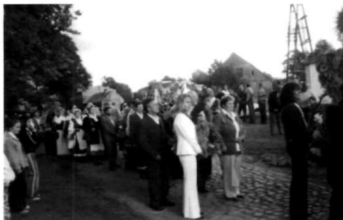
Gminne Dożynki w 2000 roku