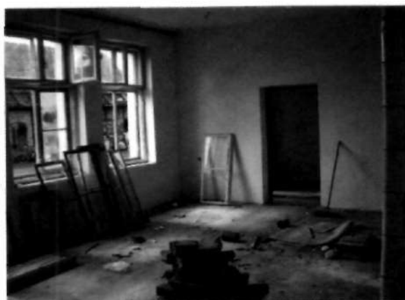
Świetlica w trakcie remontu