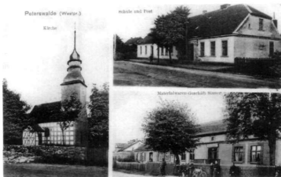
Cierznie w starej fotografii