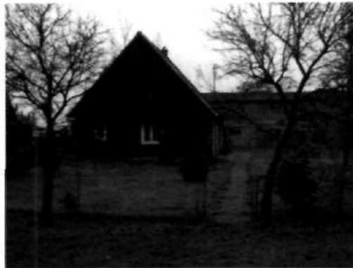
Zabytkowa podcieniowa chałupa w Cierzniach – XVIII wiek