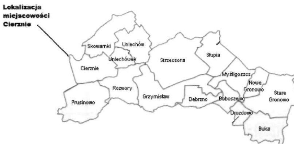
Mapa: Lokalizacja miejscowości na tle innych sołectw Gminy Debrzno