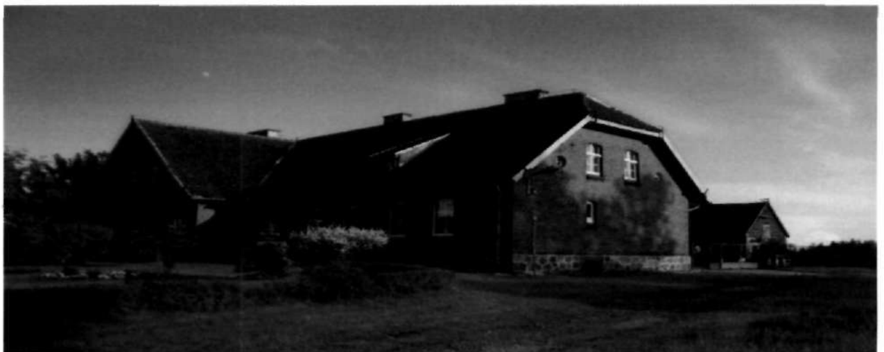
Budynek szkoły, podlegający ochronie.