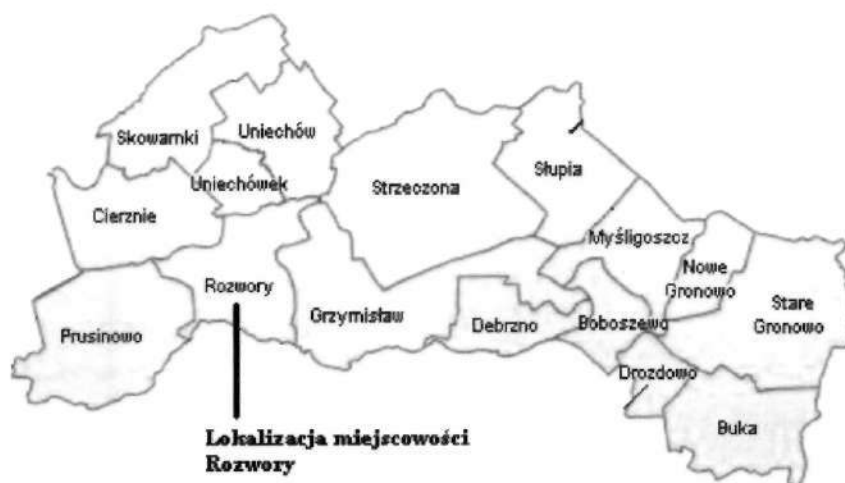
Mapa: Lokalizacja miejscowości na tle innych sołectw Gminy Debrzno