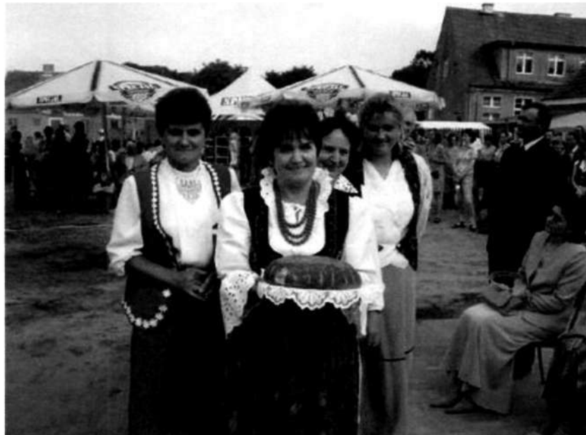
Dożynki gminne we wsi Skowarnki

We wsi Skowarnki rok rocznie organizowanych jest wiele imprez, zabaw i konkursów, z których część ma charakter cykliczny. Do najważniejszych i najpowszechniejszych należą: Dzień Dziecka, Dzień Kobiet, Dzień Babci i Dziadka, dożynki, zabawy choinkowe i sylwestrowe, itp. Miejscem spotkań, zabaw i imprez są: świetlica wiejska, boiska.