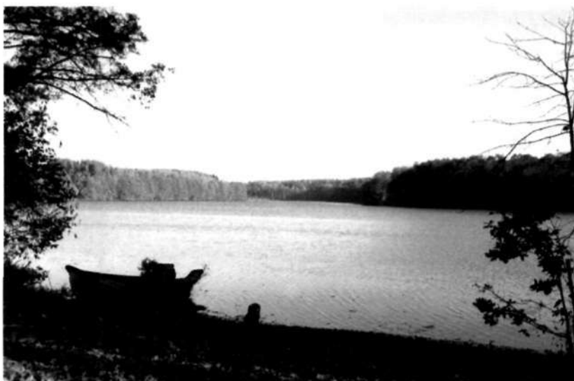
Fotografia jeziora Czarnowo Duże

Miejscowość Skowarnki położona w Gminie Debrzno przynależy do makroregionu Pojezierza południowo-pomorskiego i mezoregionów Pojezierza Krajeńskiego i Bytowskiego. Ulokowana jest na wysoczyźnie morenowej pośród malowniczych terenów o dużych walorach turystycznych. Wieś charakteryzuje urozmaicona konfiguracja terenu. Położona jest wśród lasów pomiędzy dwoma – rozpościerającymi się wśród wzgórz jeziorami rynnowymi Czarnowo Małe (23,15 ha powierzchni) i Czarnowo Duże (1,47 ha powierzchni) oraz rzeką Szczyrą (4.300 m długości) – dopływem rzeki Gwdy, której dolina rozcina płaskie doliny sandrowe na północnym – zachodzie. W jeziorach występuje chroniony gatunek ryby – „Różanki”.