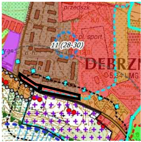
Wyrys ze studium uwarunkowań i kierunków zagospodarowania przestrzennego miasta i gminy Debrzno