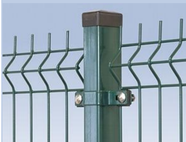
Rys. Nr 1