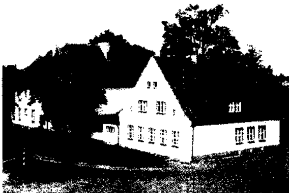
Budynek szkoły podstawowej

potrzeby zajęć wychowania fizycznego zaadaptowano jedno z pomieszczeń mieszczące się w szkole. Do obwodu szkolnego należą: Nowe Gronowo, Buka oraz Drozdowo.