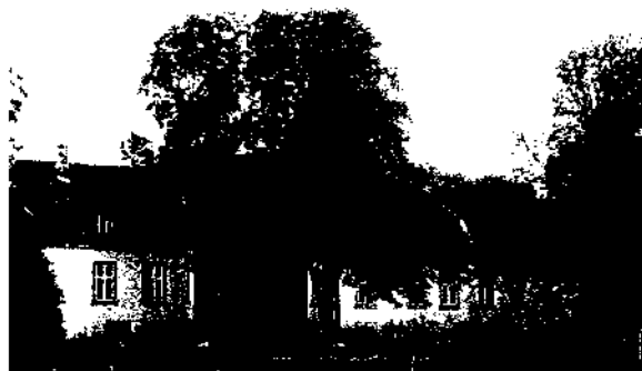
Grunau - Parkseite

Konkludując Stare Gronowo to wieś o wyjątkowych walorach przestrzenno - kulturowych, łącząca kilka samodzielnych elementów przestrzennych: wieś chłopską po wschodniej stronie z kościołem w placu owalnicy, zespół pałacowo - folwarczny w części północnej i zachodniej oraz gorzelnię po południowo - zachodniej stronie. Mimo licznych zmian wieś w całości zachowała swój harmonijny wygląd, powiązanie siecią dróg samodzielnych elementów przestrzennych o odmiennych funkcjach, a także co ważne - czytelność układu tych elementów.