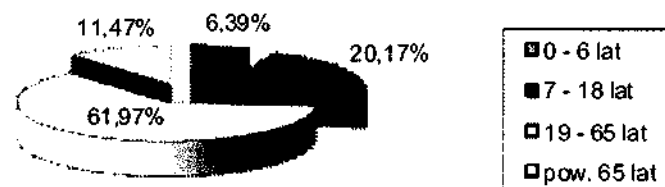
Wykres: Struktura ludności - Stare Gronowo

Mieszkańcy Starego Gronowa to aż w 95 % ludność napływowa. Zdecydowana część utrzymuje się z rent, emerytur, zasiłków dla bezrobotnych bądź pracy poza miejscem zamieszkania. Natomiast gospodarstwa rolne są źródłem utrzymania tylko dla nielicznej grupy mieszkańców sołectwa.