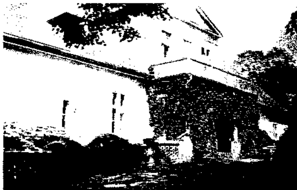
Gutshaus Grunau - Vorderseite

Wieś charakteryzuje czytelny układ ulicowy - specyficzny dla XIX-wiecznego planowania - o charakterze zagrodowym. Wieś Stare Gronowo rozciąga się wzdłuż osi wschód - zachód, z tym, że starsza część wsi ulokowana jest po stronie wschodniej. Tutaj też widoczny jest zachowany plac owalnicowy wsi, w przestrzeni którego zlokalizowany jest kościół. Ta właśnie część stanowiła wspólnotową gminę wiejską. Na zachód od niej istniał majątek