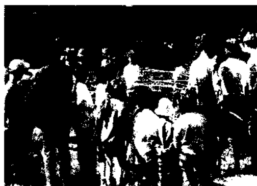
Zabawy podczas obchodów Dnia Dziecka

Do najważniejszych i najpowszechniejszych należą: Dzień Dziecka, Dzień Kobiet, Dzień Babci i Dziadka, festyny strażackie, coroczne plenery ceramiczne, konkurs „Piękna Zagroda”, festyn integracyjny pod hasłem „Razem lepiej i weselej” turniej sołectw, Dzień Braterstwa Stworzeń, letnie biwaki, dożynki, zabawy choinkowe i sylwestrowe, Dzień Seniora,