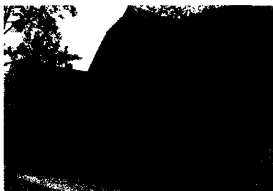
Źródło: zasoby własne Stowarzyszenia

Infrastruktura sportowa, którą dysponuje miejscowość Stare Gronowo jest niewystarczająca do potrzeb mieszkańców wsi, wobec czego planuje się zbudowanie funkcjonalnej sali gimnastycznej połączonej z budynkiem szkolnym łącznikiem, w którym mieścić się ma stołówka oraz kuchnia, zrekultywowanie boiska przed szkołą, wymiana części ogrodzenia. Konieczny jest również dalszy remont budynku szkoły (termoizolacja i elewacja budynku) oraz doposażenie sali komputerowej.