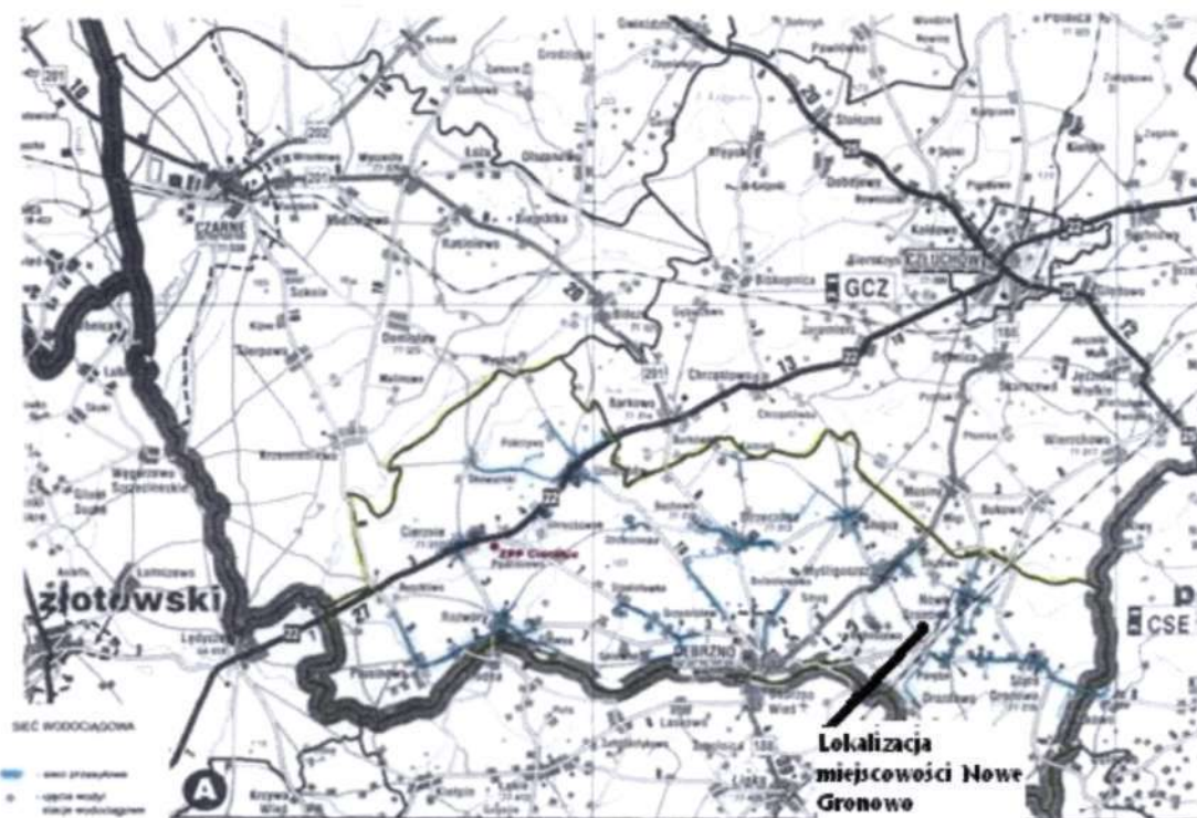
Mapa: Sieć wodociągowa Gminy Debrzno

Kilka gospodarstw posiada łącze internetowe.