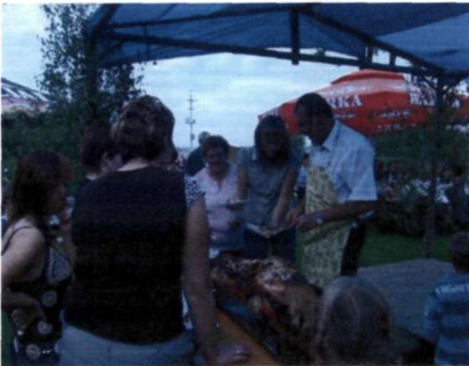
(Festyn w Nowym Gronowie)