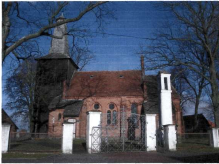
(Kościół p.w. Św. Bartłomieja)

Od tego czasu istniał więc na pewno w Uniechowie kościół, będąc jednocześnie samodzielną