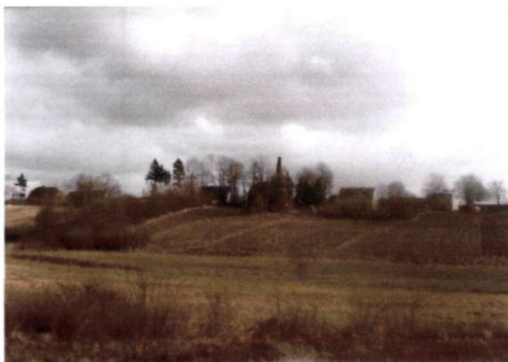
(panorama wsi)