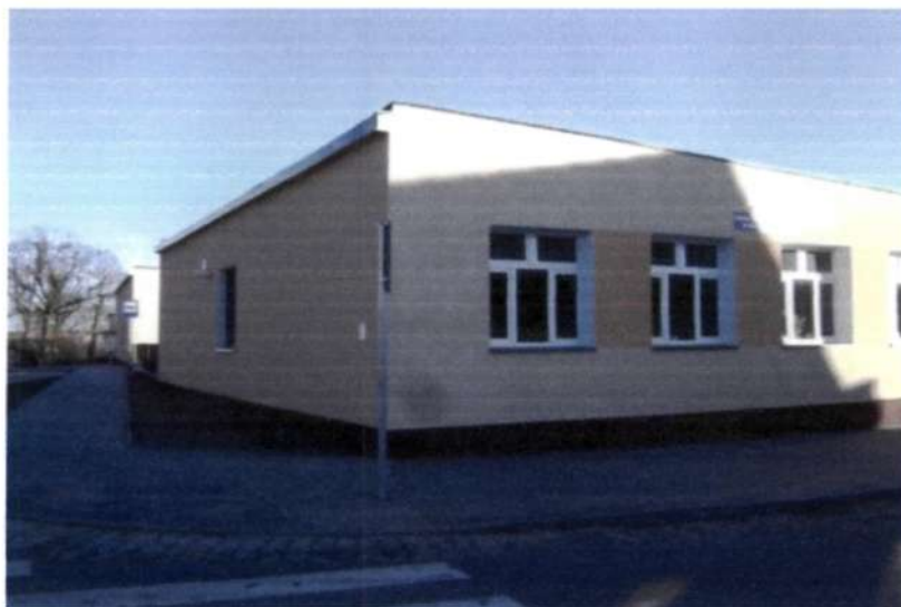
(fragment SP w Uniechowie)

Wieś położona jest przy drodze krajowej nr 22. W jej centrum mieści się: Kościół Parafialny p.w. Św. Bartłomieja, szkoła podstawowa do której uczęszcza obecnie 94 uczniów i świetlica, dwa sklepy.