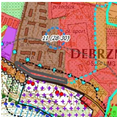
Wyrys ze studium uwarunkowań i kierunków zagospodarowania przestrzennego miasta i gminy Debrzno