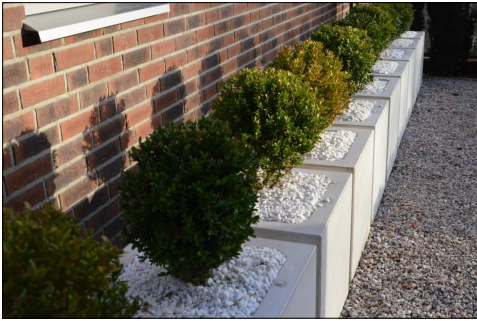
DONICE NA ZIELEŃ Z BIAŁEGO BETONU