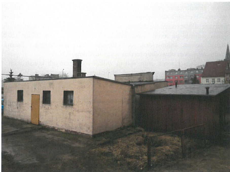
Rysunek 7 Budynek lodziarni - widok od wewnętrznej strony działki.