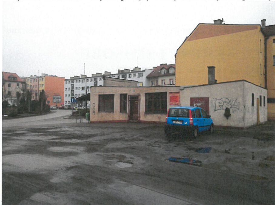
Rysunek 1 Budynek PKS - widok od strony zachodniej