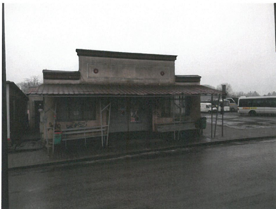
Rysunek 4 Budynek PKS - widok od strony rynku