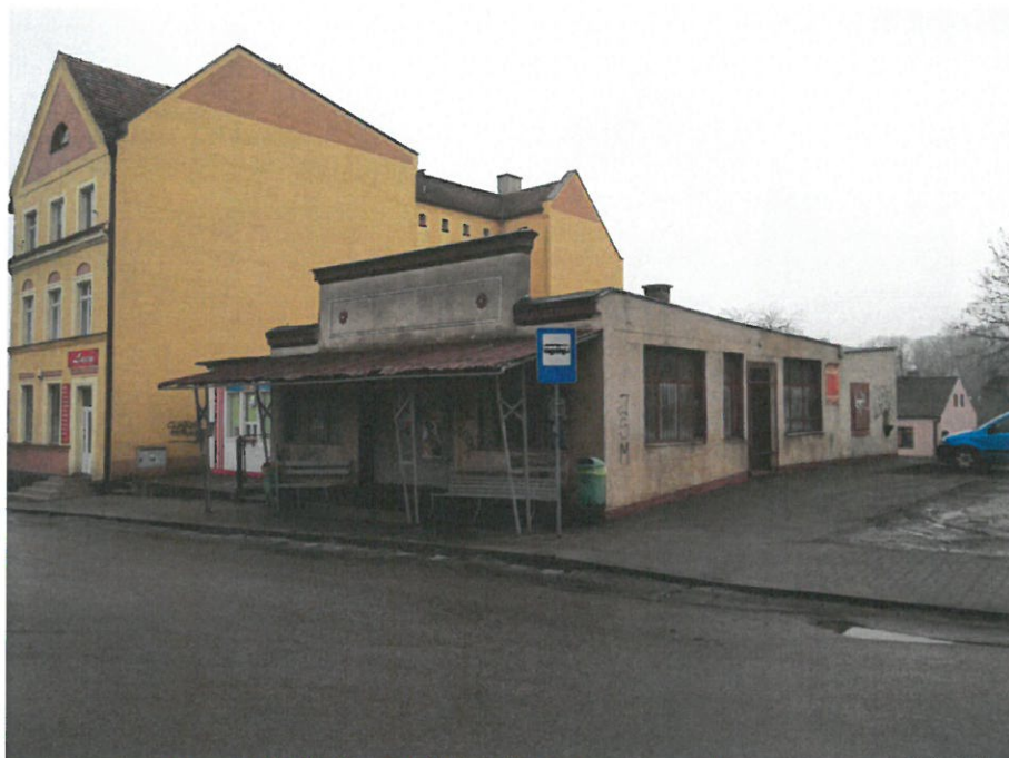
Rysunek 3 Budynek PKS - widok od strony rynku