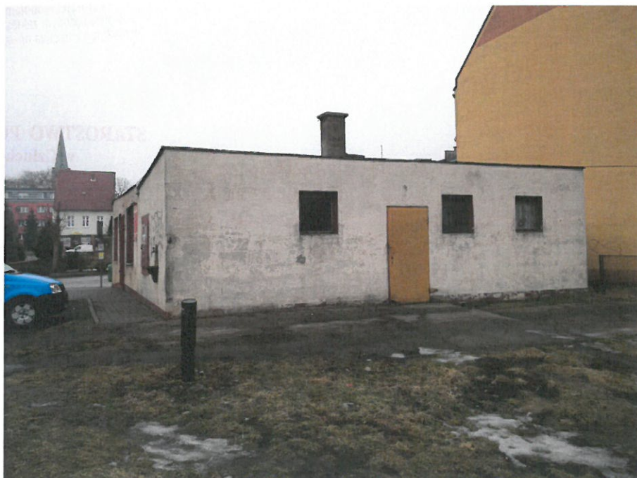
Rysunek 2 Budynek PKS - widok od strony południowej