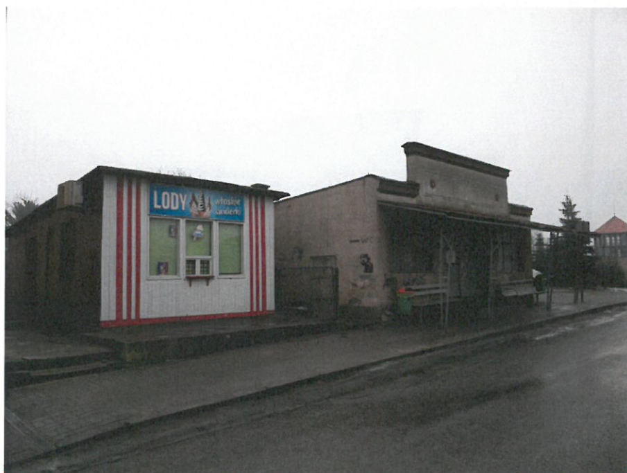
Rysunek 6 Budynek lodziarni - widok od strony rynku