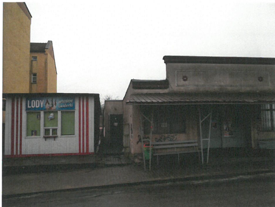
Rysunek 5 Budynek lodziarni - widok od strony rynku